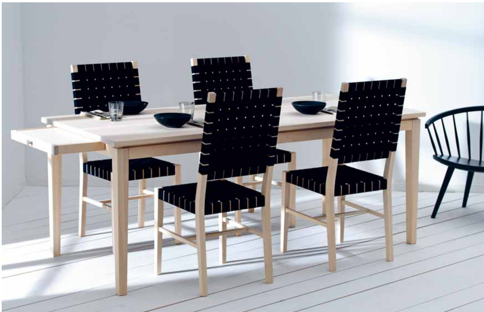
ALLEGRO BORD OCH STOL MED SADELGJORD, FORM: MARIT STIGSDOTTER. ARKA LOUNGESTOL, FORM: YNGVE EKSTRÖM