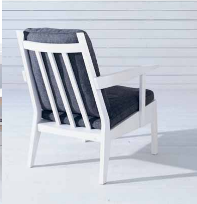
OXFORD LOUNGEFÄTÖLJ, FORM: MATTIAS LJUNGGREN. EMMA SOFFBORD, FORM: MARIT STIGSDOTTER