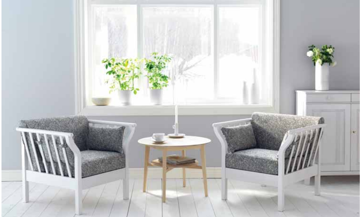
ANDANTE FÄTÖLJ, EMMA SOFFBORD, FORM: MARIT STIGSDOTTER. VARDAGS SKÄNK, FORM: CARL MALMSTEN ©