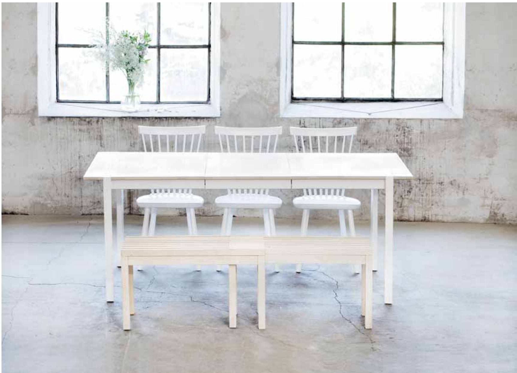
LILLA ÅLAND STOL, FORM: CARL MALMSTEN © CAMBIO UTRAGBAR BÄNK, FORM: MARIT STIGSDOTTER. PLEASE BORD, FORM: MATILDA LINDBLOM