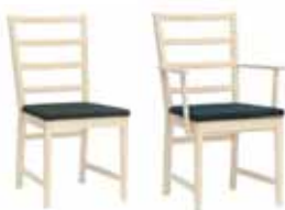
VENA Stol 9040: H 90, B 45, D 56, sits: D 44, H 46. Karmstol 9041: H 90, B 53, D 56, sits: D 44, H 46. Höjd till armstöd: 65. Form: Marit Stigsdotter