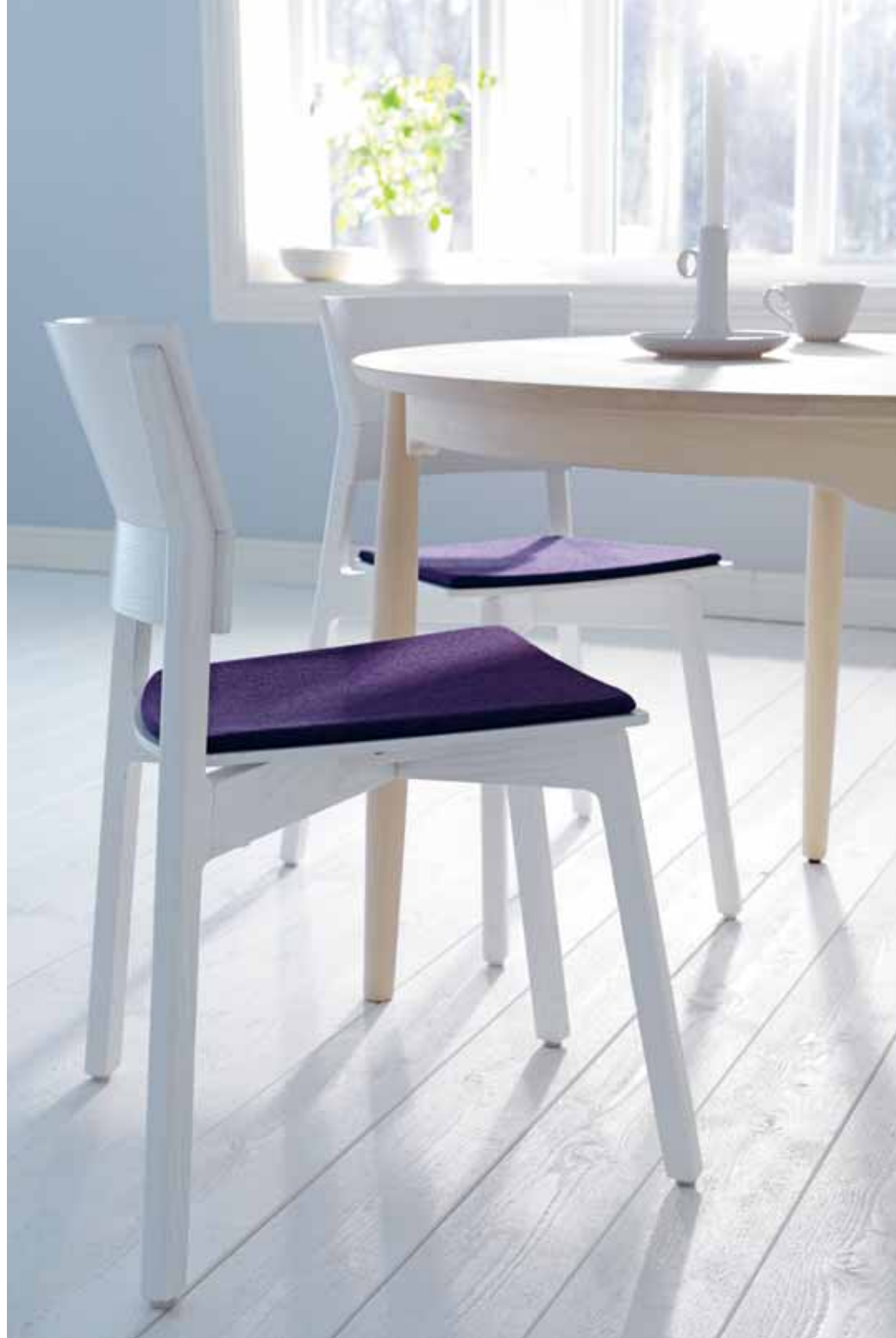
EXCELSA STOL, FORM: MATILDA LINDBLOM. CARL BORD, FORM: MARIT STIGSDOTTER