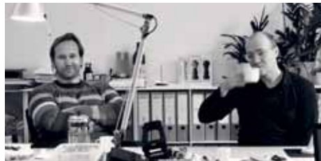
ANDERSSEN & VOLL