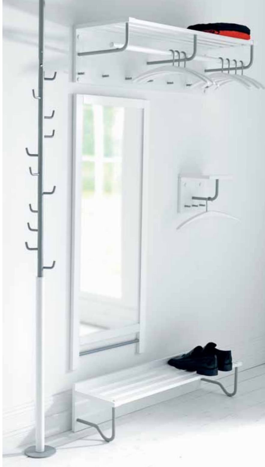
ENTRÉ HALLSERIE, KROKHOLMEN KLÄDHÄNGARE, FORM: MARIT STIGSDOTTER