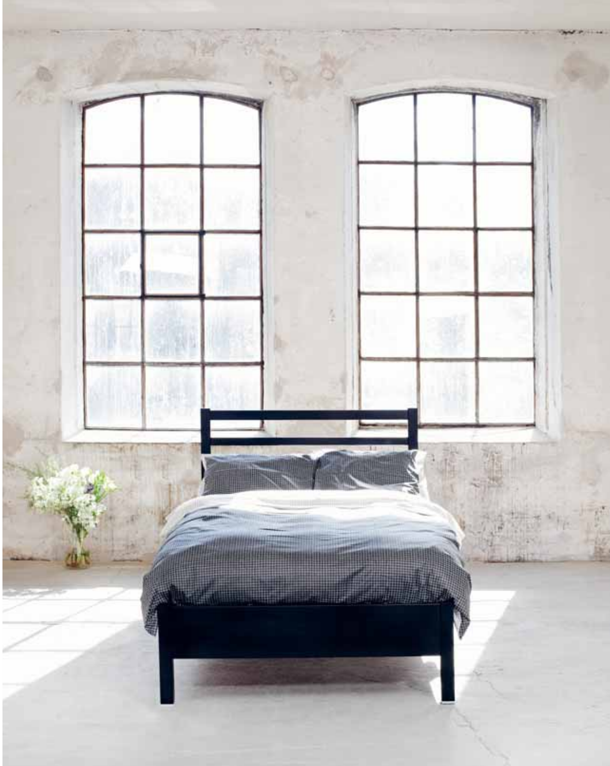
SERENA SÄNG, FORM: MARIT STIGSDOTTER