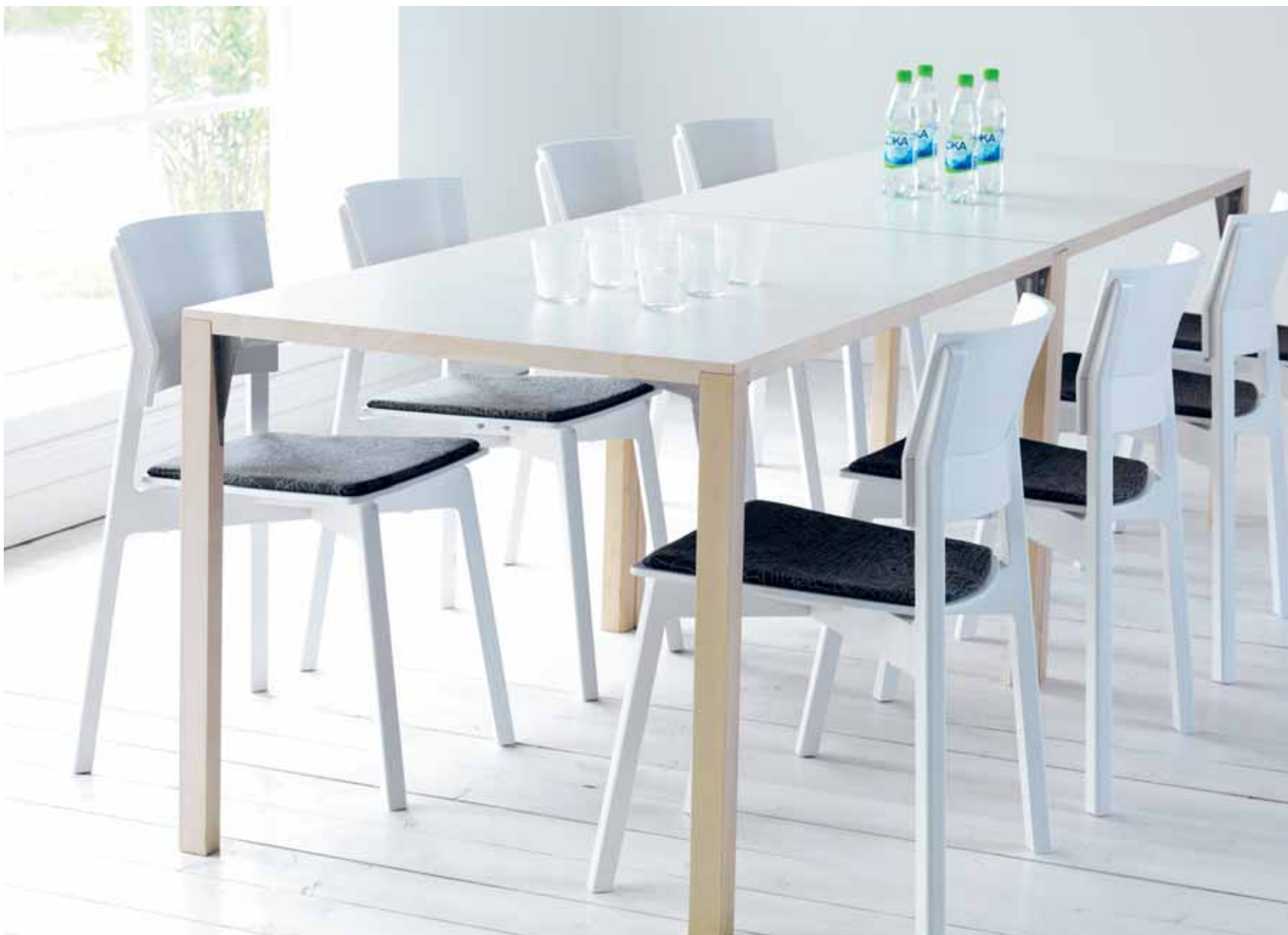
EXCELSA STOL, FORM: MATILDA LINDBLOM. SOLO BORD, FORM: MARIT STIGSDOTTER