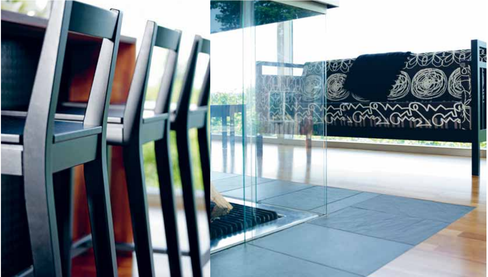
ALLEGRO BARSTOL, ADESSO SOFFA, FORM: MARIT STIGSDOTTER