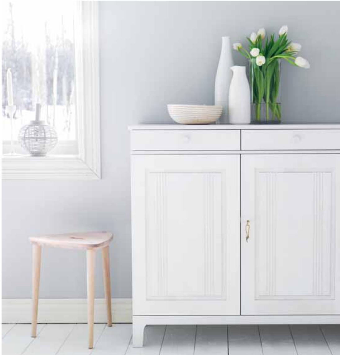
SGABELLO PALL, FORM: MARIT STIGSDOTTER. VARDAGS SKÄNK, FORM: CARL MALMSTEN ©