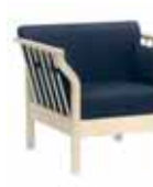
ANDANTE Fåtölj 8021: H 76, B 83, D 80, sits: D 48, H 45. Höjd till armstöd: 70. Form: Marit Stigsdotter