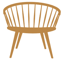
STOLAB. ETABLERAT 1907