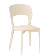
LUNA Stapelbar stol 9055: H 82, B 48, D 51, sits: D 38, H 45. Kan fås med klädd sits. Form: Marit Stigsdotter