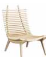
IBBI Loungestol 9020: H 99, B 60, D 90. Nackkudde/svankstöd och sittdyna finns som tillval. Form: Nils Gulin