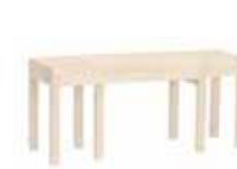
CAMBIO Utdragbar bänk 9068: H 45, B 35, L 82-148. Form: Marit Stigsdotter