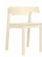
ERIK Stapel-, kopplings- och upphängningsbar karmstol 9047: H 70, B 51, D 49, sits: D 40, H 45. Kan fås med klädd sits. Form: Marit Stigsdotter