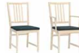
SANDÖ Stol 9042: H 90, B 45, D 56, sits: D 44, H 46. Karmstol 9043: H 90, B 53, D 56, sits: D 44, H 46. Höjd till armstöd: 65. Karmstol XL 9044: H 90, B 62, D 58, sits: D 46, H 51. Höjd till armstöd: 65. Tillval: Sitthöjd 51. Form: Marit Stigsdotter