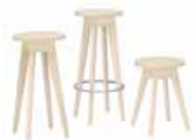
KNAPPEN Pall 9062: H 45, B 41. 9063: H 65, B 40. Barpall 9064: H 75, B 38. Form: Marit Stigsdotter