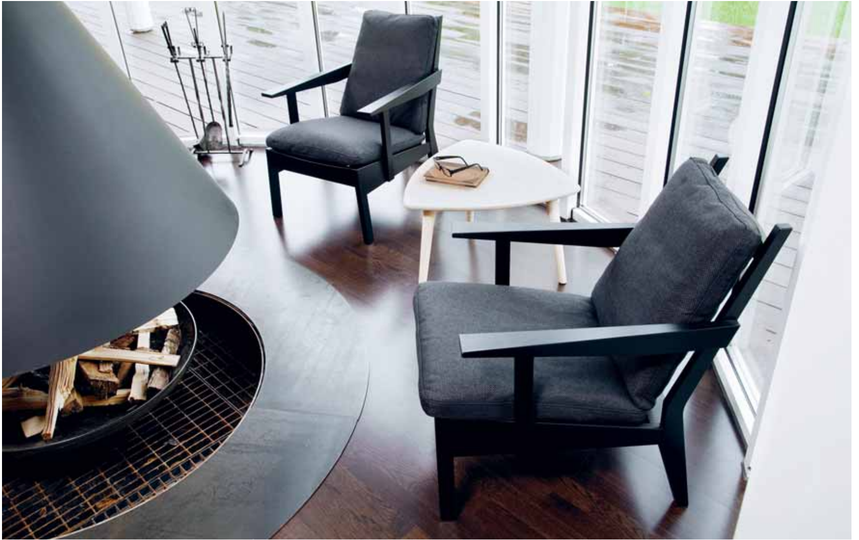
OXFORD LOUNGEFÄTÖLJ, FORM: MATTIAS LJUNGGREN. YNGVE BORD, FORM: MARIT STIGSDOTTER