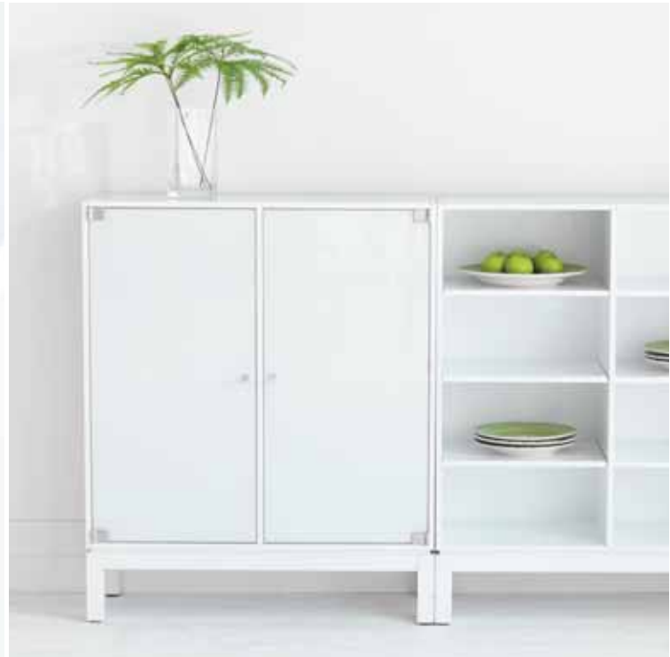
MINERVA FÖRVARING, FORM: MARIT STIGSDOTTER