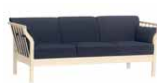
ANDANTE Soffa 2-sits 8022: H 76, B 137, D 80, sits: D 48, H 45. Höjd till armstöd: 70. Soffa 3-sits 8023: H 76, B 193, D 80, sits: D 48, H 45. Höjd till armstöd: 70. Form: Marit Stigsdotter