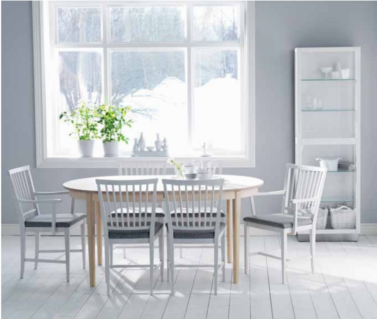
VARDAGS STOL, KARMSTOL OCH BORD, FORM: CARL MALMSTEN ©. POLARIS VITRINSKÅP, FORM: MARIT STIGSDOTTER