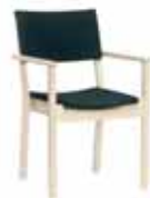
VÄLLÖ Stapel- och kopplingsbar karmstol 9046: H 85, B 53, D 59, sits: D 46, H 45. Höjd till armstöd: 64. Form: Marit Stigsdotter