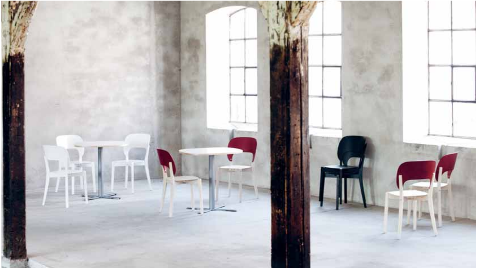
LUNA STOL OCH CAFÉBORD, FORM: MARIT STIGSDOTTER