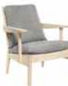
OXFORD Loungefåtölj 8041: H 77, B 57, D 75, sits: D 47, H 33. Höjd till armstöd: 71. Form: Mattias Ljunggren