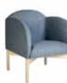
MOLN Fåtölj 8051: H 83, B 71, D 68, sits: D 53, H 45. Höjd till armstöd: 74. Form: Anderssen & Voll